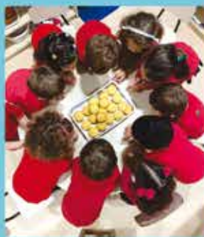
Infantil 3 E - Cooking Project - KP4 - June Party: Brazilian colorful festivity.