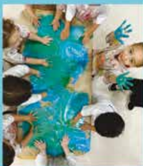
Infantil 1-2 F - NP8 - Amazing animals. We care about them.