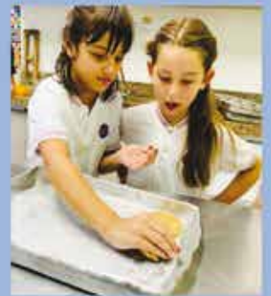
1st Grade - The Mood in Food: From Body To Brain!