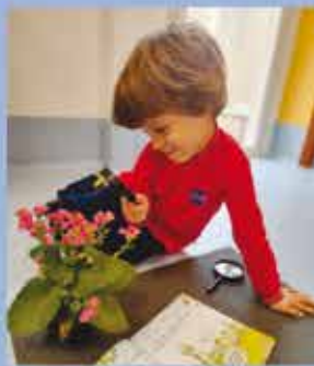
3-5 B - P3 - The seasons of the year: exploring the journey.