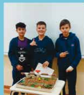
5th grade - No Wares, no life.

As crianças gostam de ensinar aos pais o que estão aprendendo em inglês. Pedir a elas que compartilhem as canções e o que estão aprendendo vai fazer com que se sintam importantes. Vale ressaltar que a família não deve pressionar a criança para que utilize o inglês no ambiente familiar, nem fazer perguntas pontuais para verificar se ela sabe ou não. Deve apenas encorajá-la para que ela se sinta importante ao compartilhar o que sabe e valorizar tudo aquilo que ela demonstra saber.