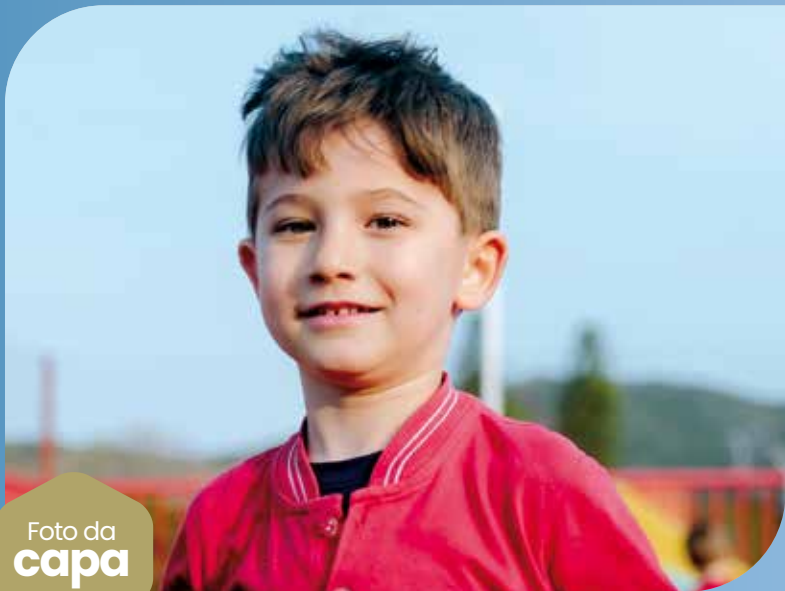
Foto da capa