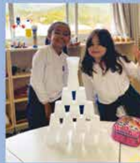
3rd Grade - City life & Country life: What do I know about them?