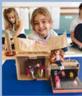
2nd Grade - There is Always a Story Behind a Toy!