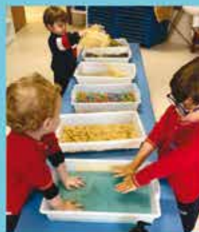
Infantil 1-2 F - NP5 - Noticing the world we live in: a sensorial discovery!