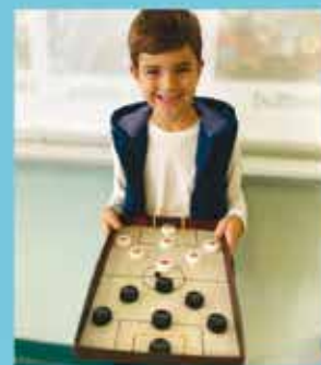
2nd Grade - There is Always a Story Behind a Toy!