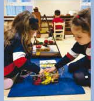
Infantil 3F - KP7 - Colorful Healthy Habits: Exploring fruits and vegetables.

A formação de bilíngues em escolas regulares é um tema cada vez mais importante na educação, ajudando os estudantes a se prepararem para um mundo globalizado. Desta forma, este FAQ responde às dúvidas mais comuns sobre educação bilíngue: a integração entre o aprendizado de língua inglesa com os conteúdos acadêmicos curriculares.