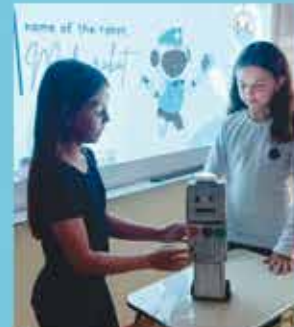
5th Grade - Technology in our daily lives.

Não haverá perdas porque os conteúdos acadêmicos que forem conduzidos em inglês serão harmonizados com o currículo em português. Os conteúdos curriculares continuarão a ser ministrados em português em todas as áreas do conhecimento. Aqueles conteúdos que forem contemplados em inglês servirão para expandir tanto o repertório acadêmico quanto o conhecimento nas duas línguas. Desta forma, as explicações e atividades se complementam, fortalecendo as aprendizagens e esclarecendo possíveis dúvidas que os estudantes venham a ter. Com a carga horária estendida em inglês, teremos cinco aulas semanais que abordarão conteúdos transdisciplinares em inglês por meio de projetos.