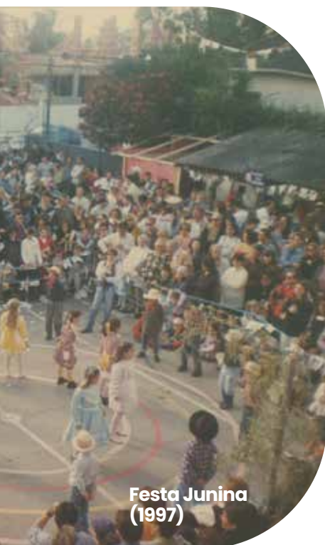
Festa Junina (1997)

As atividades extracurriculares - como dança, coral, olimpíadas, festas juninas, projetos sociais, congressos, publicações e intercâmbios - expressam o compromisso da escola com a formação integral. En-