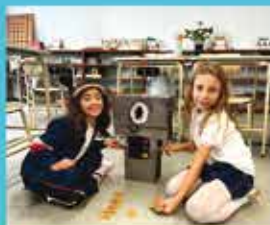
Project: There is always a story behind a toy - 2nd grade