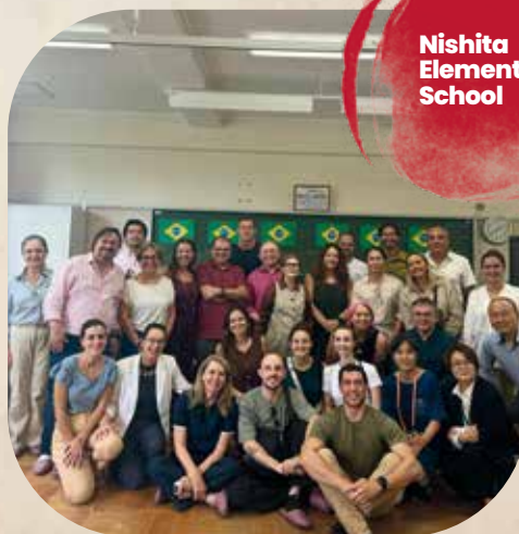
Nishita Elementary School