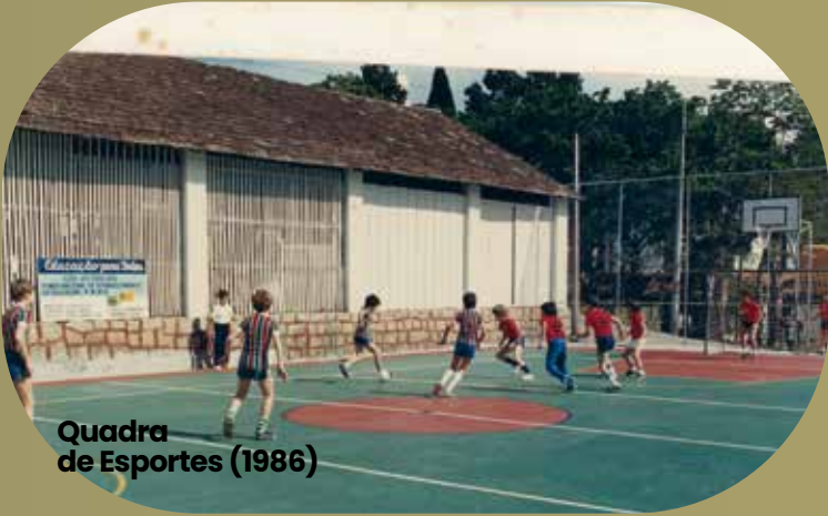
Quadra de Esportes (1986)