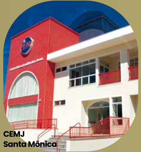
CEMJ Santa Mônica