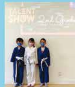
Project: A challenge a day, keeps the boredom away 2nd grade