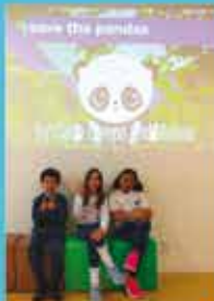
Project: Keeping and being responsible for the balance of nature 4th grade.

Responsabilidade mútua na cultura da paz e bem- Início da Formação de bilíngues no Lar Recanto do Carinho e avanço orgânico no currículo em inglês nas turmas do 4º ano SEDE.