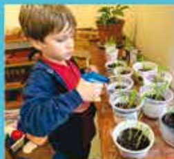
Project: Exploring the garden, learning through observation and experimentation infantil 3-5