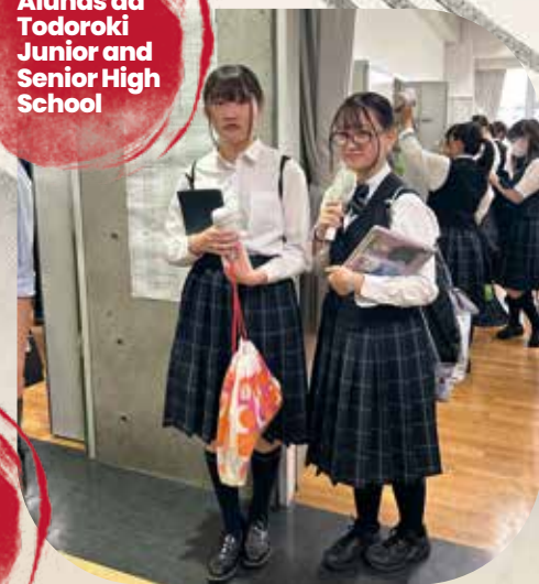
Alunas da Todoroki Junior and Senior High School