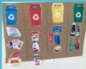
Project: Planet in Movement: Pathways to a More Sustainable World - Infantil 3-5

From Trash to Transformation - Currículo integrado e alinhado à cultura e compromisso com a escola.