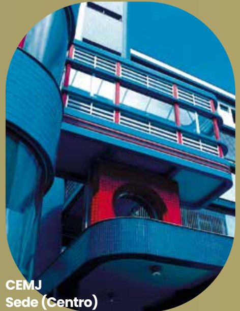
CEMJ Sede (Centro)