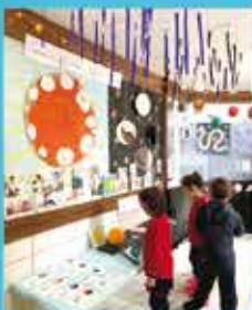
Project: Cosmos: Human life on Earth - Infantil 3-5

Início da formação de bilíngues no último ano do ensino fundamental anos iniciais e primeiro ano no Ensino Fundamental anos finais - 5º e 6º ano Bilingue.