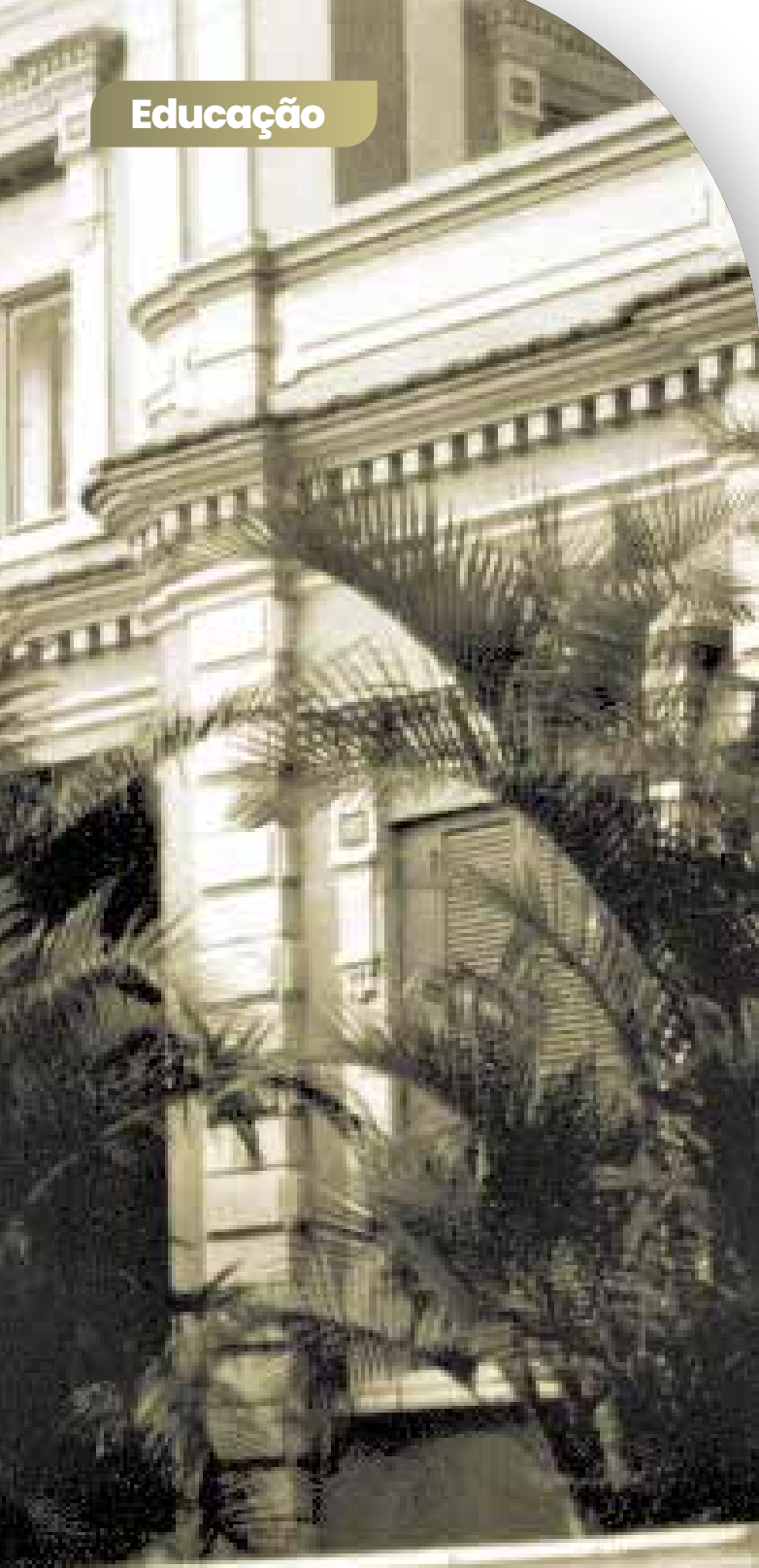
Casa da Rua Bocaiúva