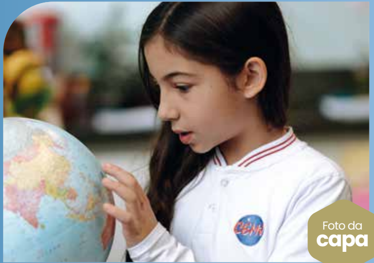
Foto da capa