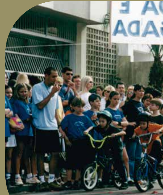
1ª Olimpíada do CEMJ (1998)