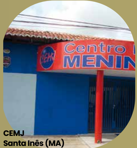
CEMJ Santa Inês (MA)