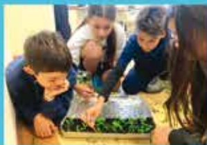
Project: No water, no life 6th Grade.