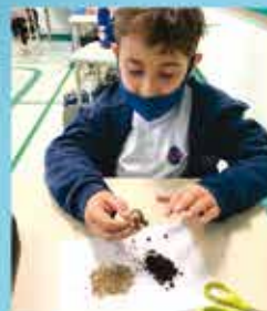
Project: What I would tell the world about the Atlantic Forest 2nd grade

De volta à rotina presencial - Progressão orgânica e currículo bilíngue nos 3º anos.