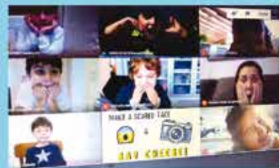
Project: My many faces and feelings - Infantil 3-5

A Reinvenção das Aulas em 2020 - O ano de muitas aprendizagens e evolução. Início da formação de bilíngues em toda Ed. Infantil, 1º e 2º anos.