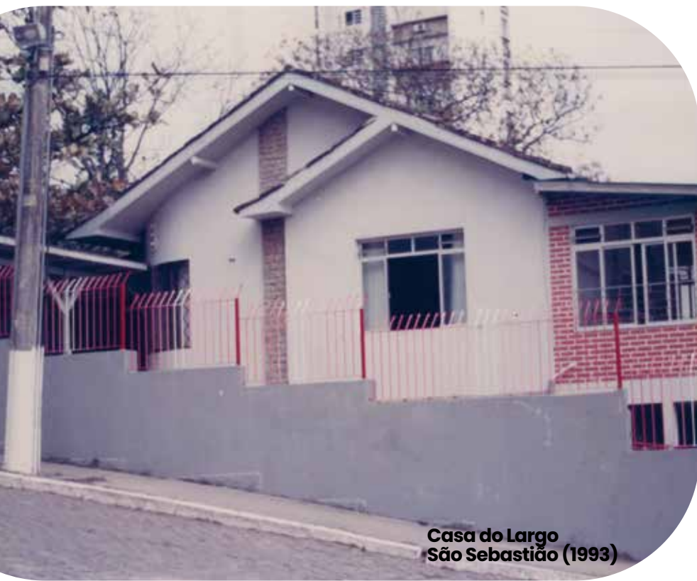
Casa do Largo São Sebastião (1993)

Nessa fase, foram organizados cursos, encontros e produzidas apostilas e materiais para a matemática e educação cósmica, áreas de especial interesse da diretora. A formação dos educadores foi intensificada, com incentivo à pós-graduação, cursos no Brasil e no exterior, além da organização de congressos e conferências em Florianópolis. Foi um período de consolidação e visibilidade nacional da proposta montessoriana aplicada no CEMJ.