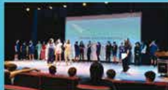
Project: Caring about health - 8th grade